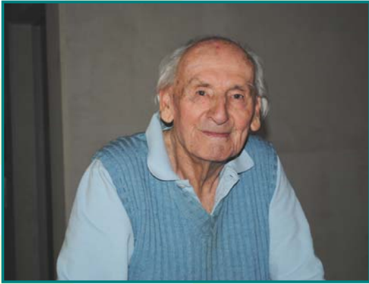
Chambre n°115 1 er étage