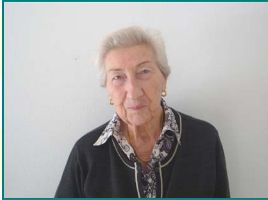
Chambre n°401 4 ème étage