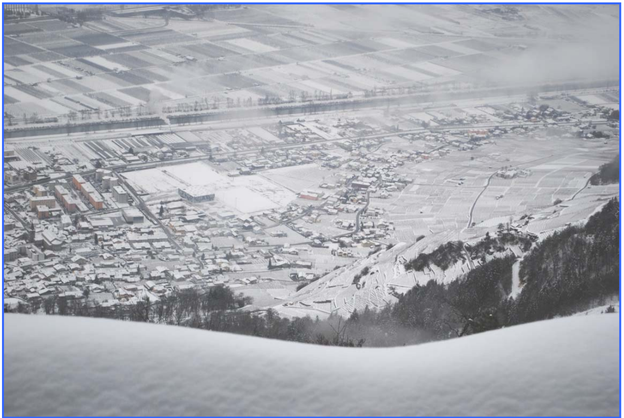
Vue de Fully depuis Planuit – Hiver 2012

Edition N°21 Janvier, Février, Mars 2012