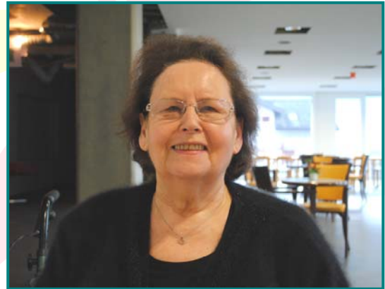
Chambre n°102 1 er étage