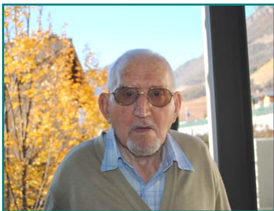
Chambre n°112 1 er étage