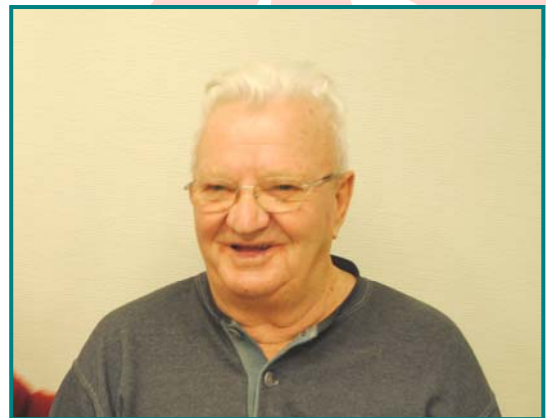
Chambre n°310 3 ème étage