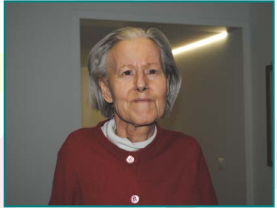
Chambre n°116 1 er étage